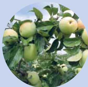
Maçã Bravo de Esmolfe DOP

As estações de Tonda, Tondela, Sabugosa (km 26,8) e 7 Parada de Gonta (km 29,8) foram requalificadas com o apoio da Medida LEADER do PRODER, através da associação ADICES. O projeto apre-