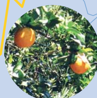
Laranjais de Castelões