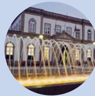
Termas de S. Pedro do Sul

Para alcançar a estação de Tondela terá de