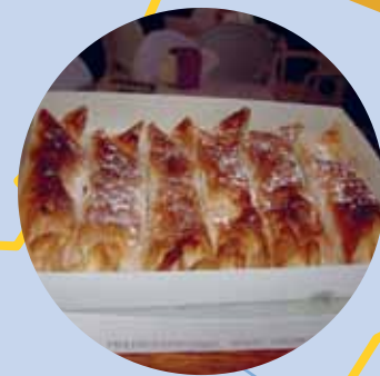
Pastéis de Vouzela