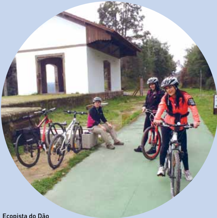
Ecopista do Dão

Percurso de ligação entre o meio urbano e rural, que se prolonga por cerca de 50 quilómetros, atravessando três concelhos – Santa Comba Dão, Tondela e Viseu –, a Ecopista do Dão é a maior do país.