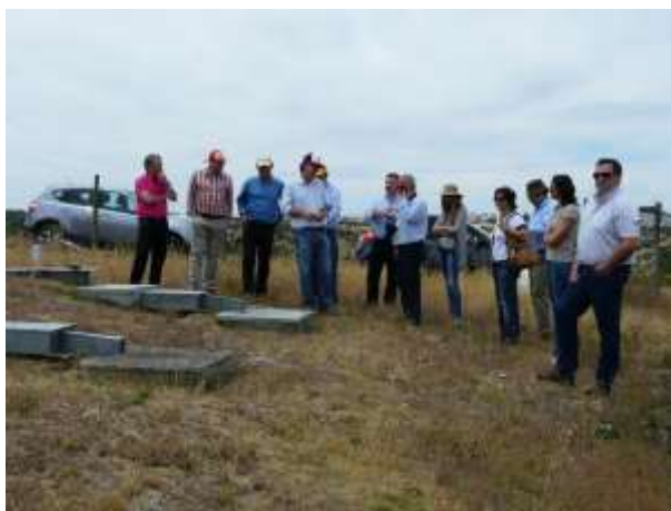
Campo Experimental de Erosão ESACB

(*) O programa deste dia inclui almoço oferecido pela Câmara Municipal de Idanha-a-Nova