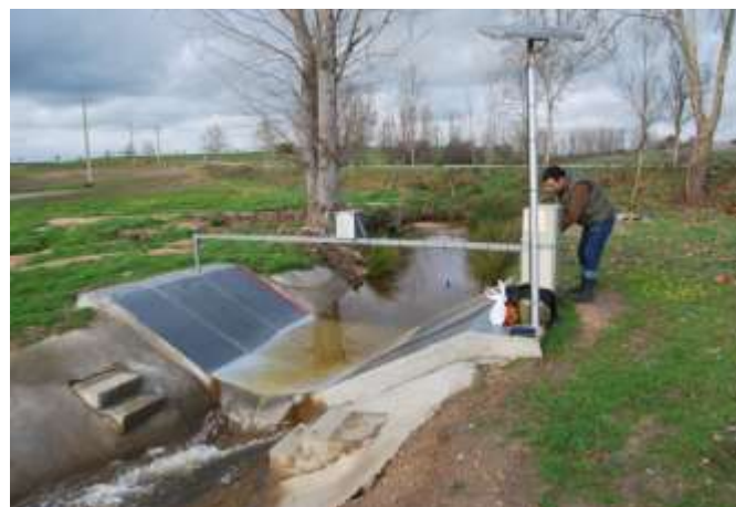
Bacia Hidrográfica Experimental ESACB