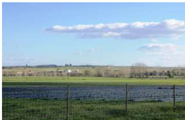
Couto da Várzea