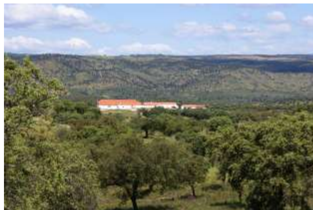
Monte do Escrivão